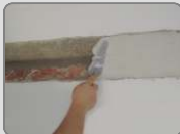
Полага се първия слой на мазилка UNICRET или UNICRET-FAST , усилени с ADIPLAST .