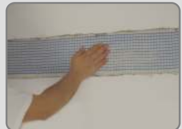
Докато първия слой е още пресен, с лек натиск се полага армировъчна мрежа.