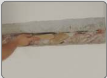
Следва почистване с твърда четка.