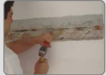
Пукнатината се разширява в дълбочина с длето.