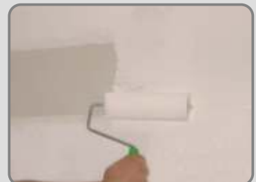
След като повърхността изсъхне, се грундира с FLEX-PRIMER и боядисва с FLEXCOAT .