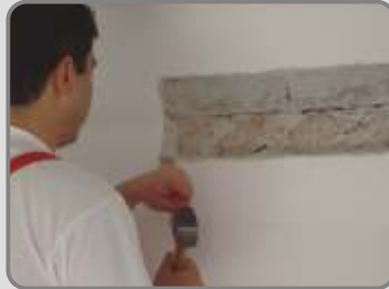
Мазилката се отстранява по дължината на пукнатината, с ширина 30 см. (по 15 см от всяка страна).