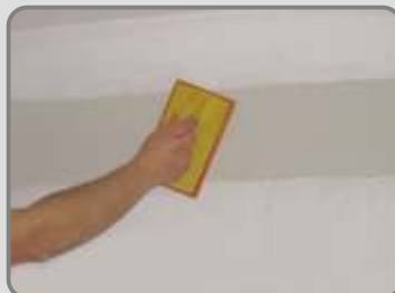
Когато изсъхне добре мазилката, се пердаши с гъбена маламашка.