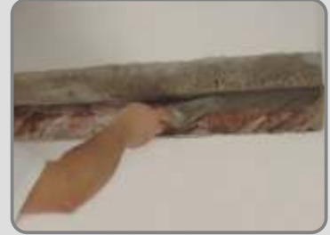
Запълва се, колкото може по дълбоко, с DUROCRET или RAPICRET . Изисква се само добавянето на вода.