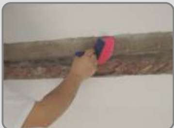
След като повърхността изсъхне, се почиства добре от прах и се навлажнява с вода.