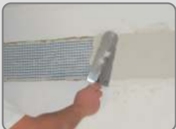
След като първия слой изсъхне, навлажнява се и се полага втория слой UNICRET или UNICRET-FAST .