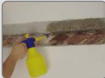
Навлажнява се добре с вода.